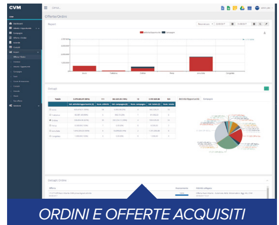
ORDINI E OFFERTE ACQUISITI