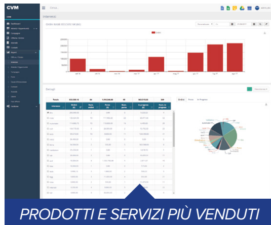
PRODOTTI E SERVIZI PIÙ VENDUTI