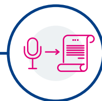
TRASCRIZIONE AUDIO IN DOCUMENTO