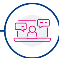
ASSISTENZA DA REMOTO