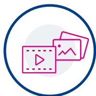
CREAZIONE FOTO E VIDEO