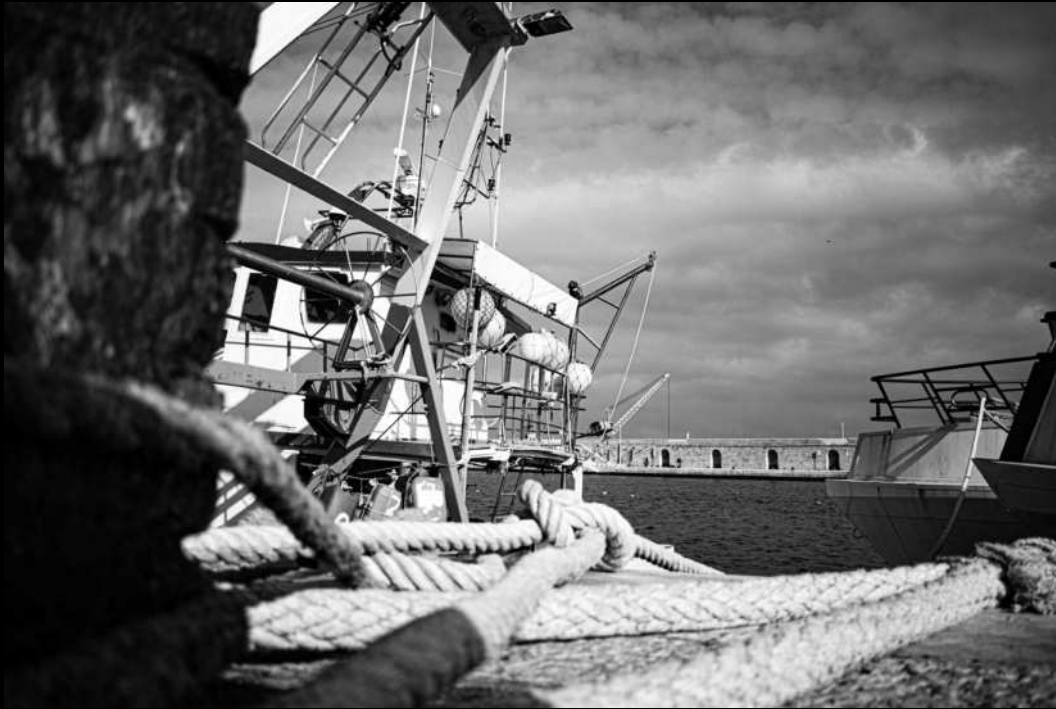
Foto 1 Ancorato alle Radici