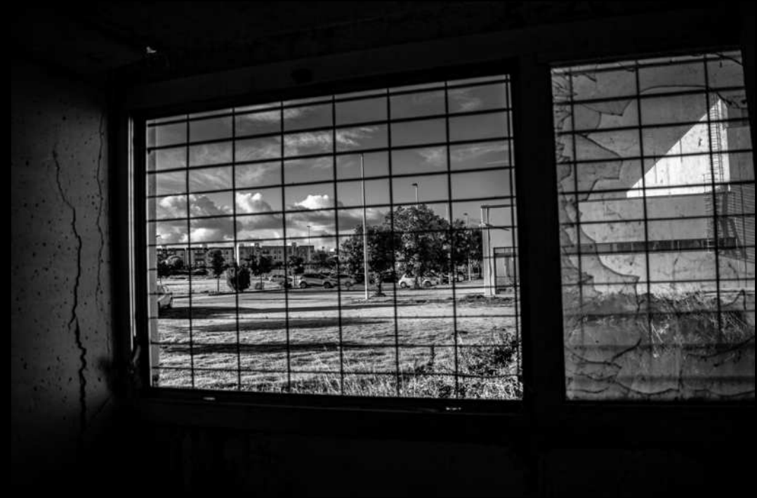
Foto 2 Speranza Infranta

Prendendo come riferimento Henri Cartier-Bresson, ho realizzato queste foto ispirandomi alla sua poetica.