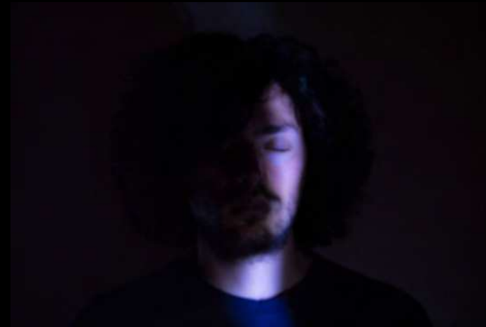
Foto 1 Luce Laterale