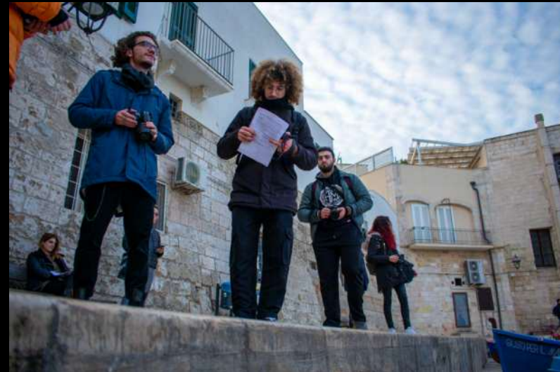
Foto 1 Campo Lunghissimo